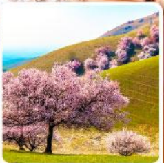
ทุ่งดอกอัลมอนต์