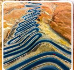
ถนนผานหลงกู่ต้าอว