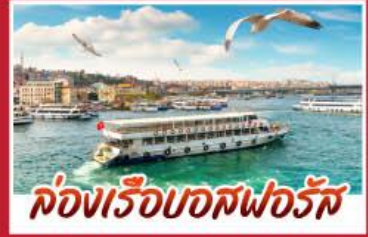
ล่องเรือบอสฟอรัส