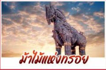
ม้าไม้แห่งกรอย