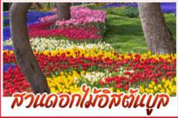
สวนดอกไม้อิสตันบูล