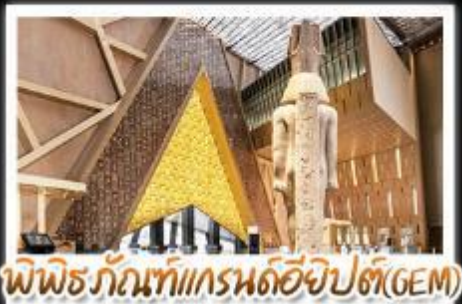
พิพิธภัณฑ์แกรนด์อียิปต์(GEM)

อารยธรรมลุ่มแม่น้ำไนล์ - พีระมิด - อเล็กซานเดรีย - เมมฟิส - ไคโร - โรงแรมระดับ 4 ดาว รวมค่าวีซ่า ทัศนะการชาย - อาหารครบทุกมื้อ