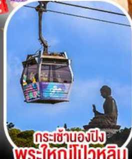
กระเช้าองปีง พระใหญ่ไผ่หลิน