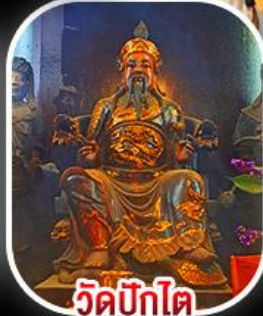
วัดบิกโต