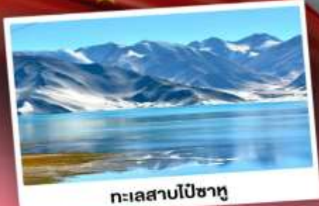
ทะเลสาบโปซาทุ

เปิดประตูสู่อารยธรรมพันปีแห่งซินเจียงใต้ ชมความสวยงามของหมู่บ้านดอกแอปเปิ้ล