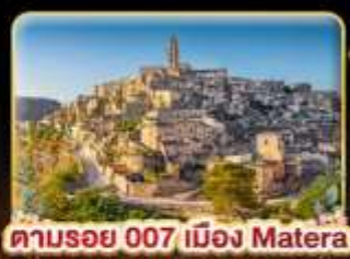
ตามรอย 007 เมือง Matera