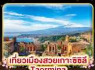
เที่ยวเมืองสวยเกาะซซิลี Taormina