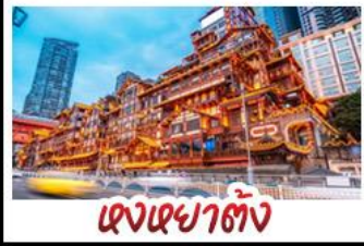
เฉงเฉงาตั้ง

อุทยานหลุมบ่อฟ้า - อุทยานเจนางฟ้า หงหยาดัง - นังรถไฟทะเลลู่ตีก - อุทยานสีดรุณี ปี้เฉิงโกว - สะพานหนานเฉียว