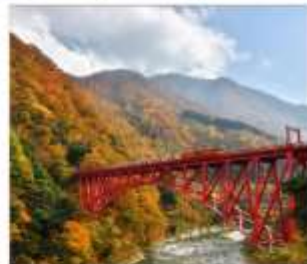
รถไฟชมวิวยุเมเวาคูโรมะะ