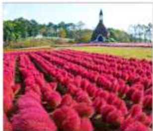
สวนดอกไม้มัมกคะโนะซาโตะ