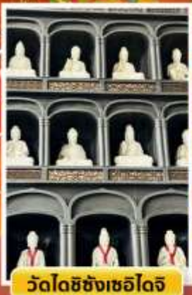
วัดไดชิซังเซโด้จิ