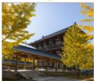
วัดไดชิซังเซอิโดจิ