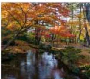
สวนเคนโระคุเซ็น