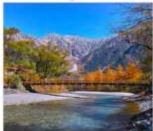
ดามิโดจิ