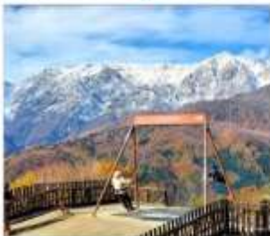
ฮาคูนะอิวาทาเกะ