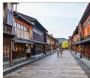
ย่านโรงน้ำชาอิงาชิฮายะ