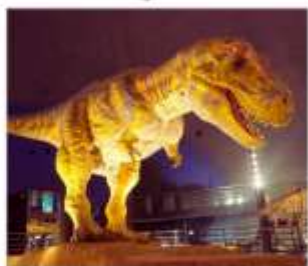
พิพิธภัณฑ์ไดโนเสาร์