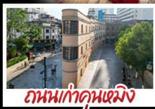
ถนนเก่าคุณหมิง