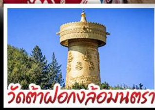
วัดต้าฝอ กงล้อมณฑล