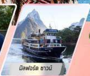
มิสฟอร์ด ซาวนี