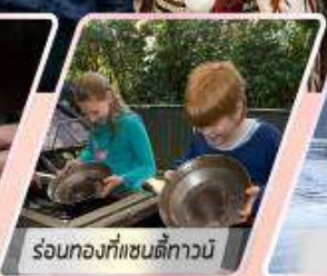
ร้อนท้องที่แซนดี้ทาวน์