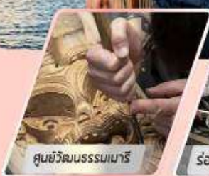
ศูนย์วัฒนธรรมเมารี

เที่ยวเกาะใต้ และเกาะเหนือ : 12 วัน 10 คืน