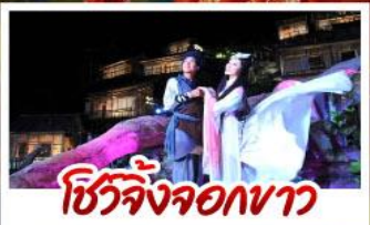
ชีวิตจิ้งจอกขาว