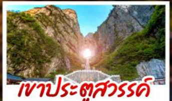
เขาประตูสวรรค์