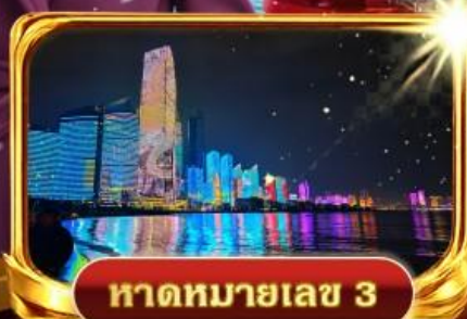
หาดหมายเลข 3