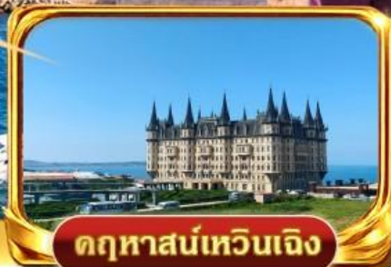
คฤหาสน์เทวินเจิง