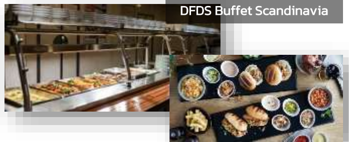
DFDS Buffet Scandinavia

ค่ำ บริการอาหารค่ำแบบบุฟเฟ่ต์ ณ ห้องอาหารของเรือ DFDS