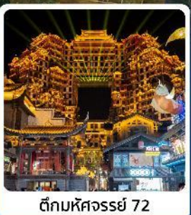
ตึกมหัศจรรย์ 72