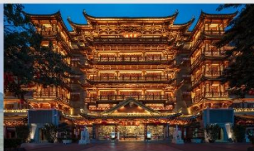
วัดต้าฝอซื่อ