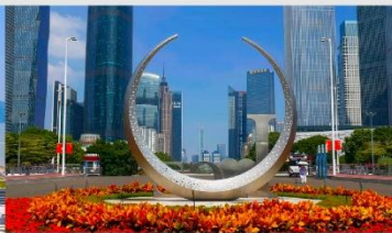
จัตุรัสฮัวเจิง

*ทางบริษัทฯ ขอสงวนสิทธิ์ในการสลับโปรแกรมทัวร์ตามความเหมาะสมขึ้นอยู่กับสถานการณ์หน้างาน โดยคำนึงถึงผลประโยชน์ของลูกค้าเป็นสำคัญ