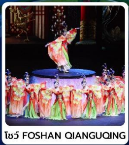
โชว์ FOSHAN QIANGQING