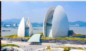
โรงละครหอยไข่มุก