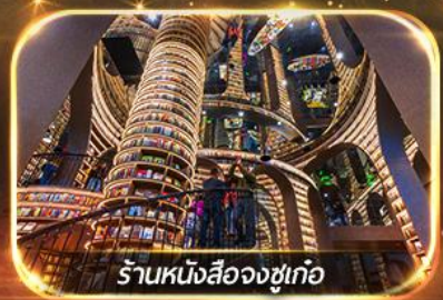
ร้านหนังสือจงซูเท่อ

เที่ยวชมทัศนียภาพ 2 อุทยาน ปี้เฟิงโก & ชวงเจียวโก