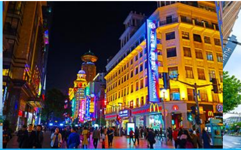
ถนนคนเดินหนานจิงลุ่