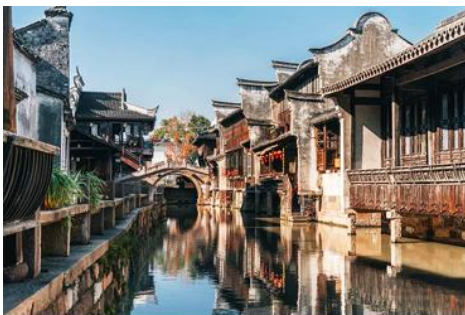
เมืองโบราณวูเจิน