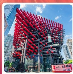
ตึกตะเกียบ

ไฮไลท์! เกี่ยวกับอุทยานแห่งชาติหลุมบ่อฟ้า มรดกโลกระดับ 5A ชมรถไฟฟ้าทะลุตึก อลังการแสงสีที่หงหยาดัง