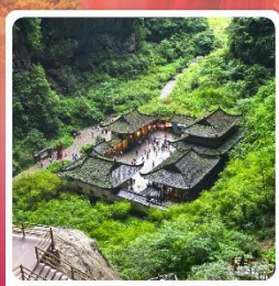
หลุมบ่อฟ้า