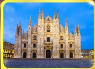
มหาวิหารแห่งเมืองมิลาน