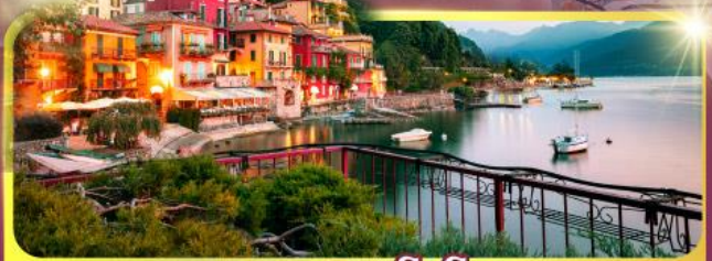
ทะเลสาบโลโบ

11-18 มิ.ย. 69 / 25 มิ.ย. - 02 ก.ค.69 02 - 09, 16-23 ก.ย.69 / 07 -14, 22-29 ต.ค.69 เดินทาง : 04 - 11, 11-18 พ.ย.69 25 พ.ย. - 02 ธ.ค.69 03 - 10, 23-30 ธ.ค.69 / 23 - 30 ธ.ค. 69 29 ธ.ค.69 - 05 ม.ค.70