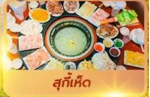
สุกี้เด็ด