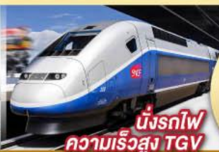
นั่งรถไฟความเร็วสูง TGV