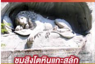
ชมสิงโตหินแกะสลัก