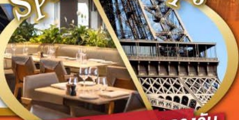
รับประทานอาหารกลางวันบนหอไอเฟล