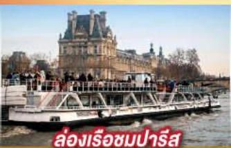
ล่องเรือชมปารีส