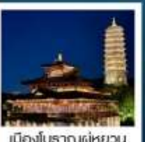
เมืองโบราณผู้หยวน

เมืองโบราณผู้หยวน / ภูเขาหินัวส์วชาน (รวมรถกอล์ฟ) ห้างสรรพสินค้าเต๋อจี / วัดจีหมิง / ทะเลสาบเซวียนอู่ ถนนอุ่งถ้ำเต๋า / อู๋ซีหมู่บ้านเหียนฮวาวาน / เซาหูซิว เชียงใหม่ คลาสสิก ไนท์ / ถนนนานกิง / Tian An 1,000 Trees North Bund Green Land / Florentia Village Outlet