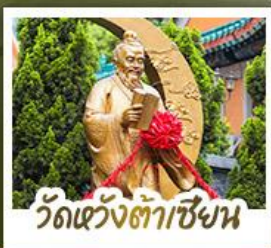
วัดเว้งต้าเซ็งน