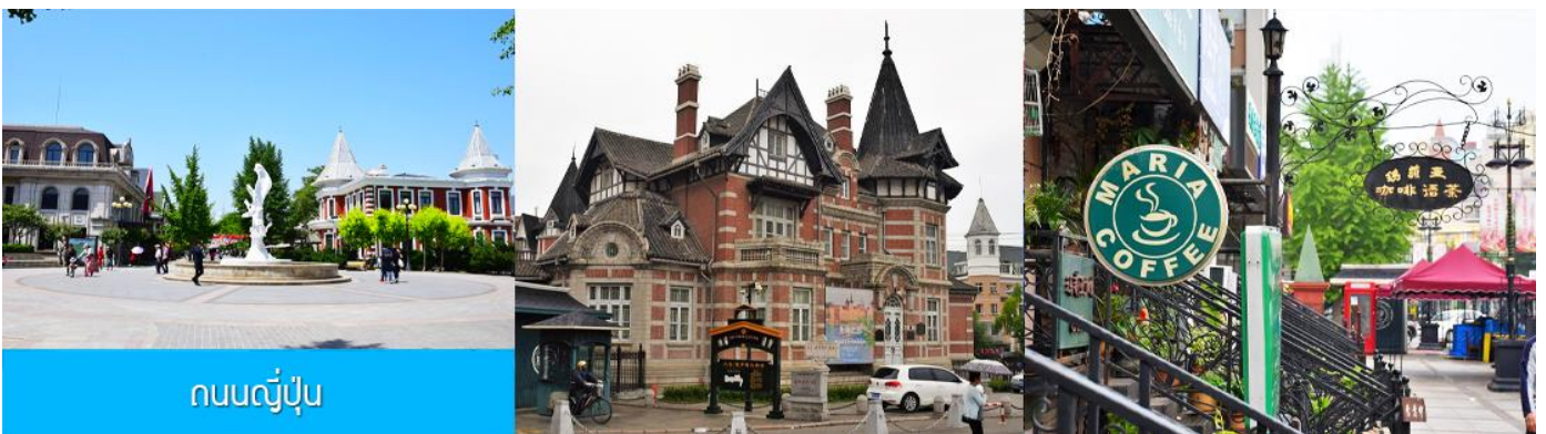
ถนนญี่ปุ่น