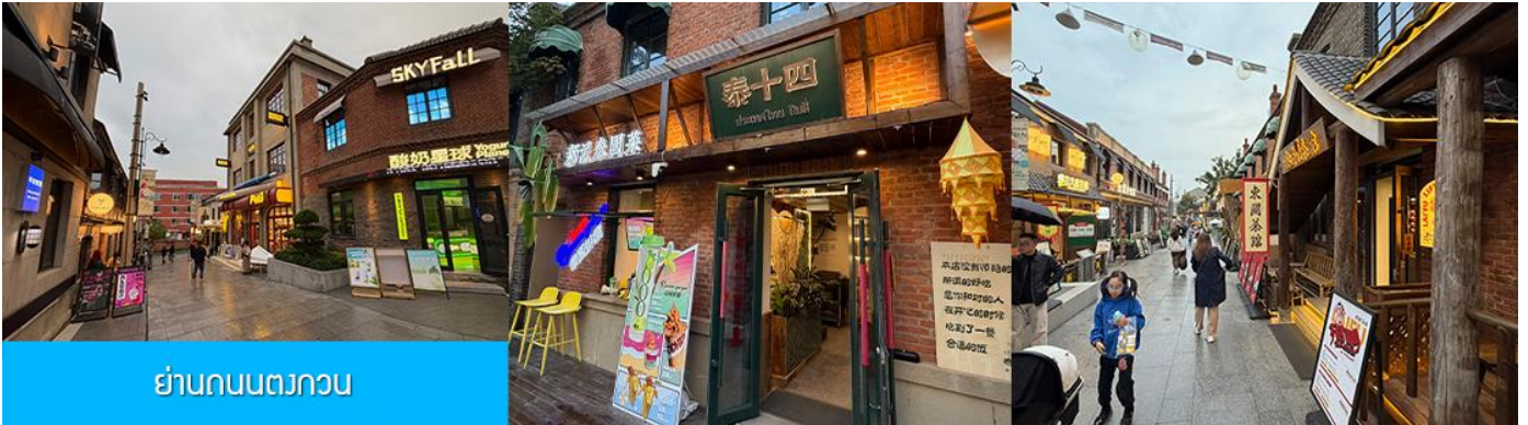
ย่านถนนตงกวน

นำท่านเที่ยวชม จัตุรัสชิงไห่ 星海广场 เป็นจัตุรัสขนาดใหญ่เป็นแลนด์มาร์คสำคัญของเมืองต้าเหลียน สร้างขึ้นเพื่อเฉลิมฉลองในโอกาสที่รัฐบาลอังกฤษคืนเกาะฮ่องกงในให้จีนในปี ค.ศ. 1997 ตั้งอยู่ชายฝั่งทะเลในเมืองต้าเหลียน เป็นจัตุรัสใจกลางเมืองที่ใหญ่ที่สุดในโลกและ เป็นแลนด์มาร์คของเมืองต้าเหลียน รายล้อมด้วยตึกกระจาที่ทันสมัย ภายในมีบ่อน้ำพุดนตรี ลานหญ้าขนาดใหญ่ และลานกว้างสำหรับจัดกิจกรรมกลางแจ้ง อาทิ เทศกาลเบียร์นานาชาติ การแข่งขันวิ่งมาราธอน งานแฟชั่นนานาชาติเมืองต้าเหลียน ฯลฯ