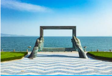
กรอบรูปวิวทะเล