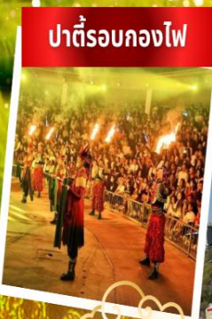
ปาร์ตี้รอบกองไฟ