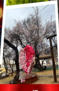
สวนแอปเปิ้ลคอก