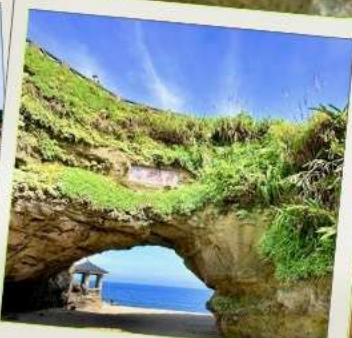
ถ้ำสี่เหมิน