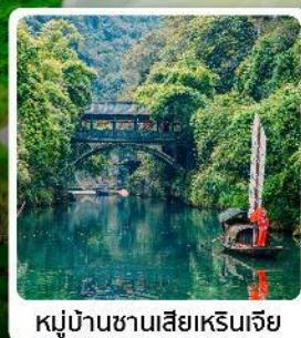
หมู่บ้านซานเสี่ยเหรินเจีย