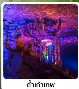
ดำเก้าทพ