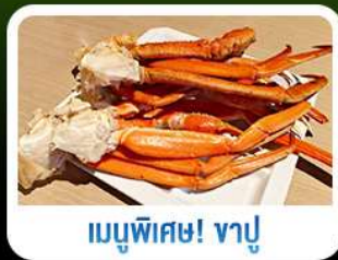
เมนูพิเศษ! หาลู