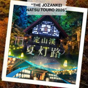
“THE JOZANKEI NATSU TOURO 2026”