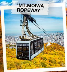
“MT. MOIWA ROPEWAY”

CHITOSE / NOBORIBETSU / TOYA / NISEKO / JOZANKEI / OTARU / SAPPORO