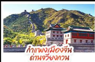
กำแพงเมืองจีน ด้านจวิ้นกวน

ส่องเรือสุดโรแมนติกแม่น้ำหวงผู้ ปักกิ่ง..เปิดประตูสู่แดนมังกร ด้วยความอลังการระดับจักรพรรดิ ชิงเต่า..เมืองชายทะเลสไตล์ยุโรป หอระฆังแบบพอนทอว เซี่ยงไฮ้..มหานครแห่งเอเชีย เมืองที่ไม่เคยหลับใหล