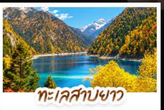
ทะเลสาบขาว