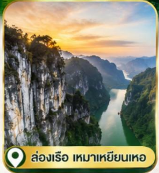
📍 ล่องเรือ เหมาเหยียนเหอ