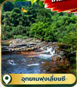
📍 อุทยานฟ่งเลี่ยนซี