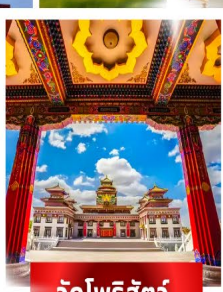
วัดโพธิ์สัตว์