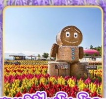
สวนซึกิไซโนะโอกะ