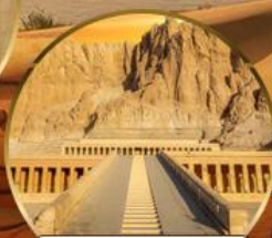
หุบเขากษัตริย์