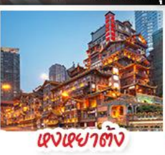
ตุงเฉียวตั้ง