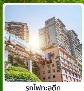
รถไฟฟ้าสุดึก