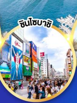
ชินโซมาชิ