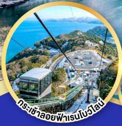
กระเช้าลอยฟ้าเรนโบว์ไลน์