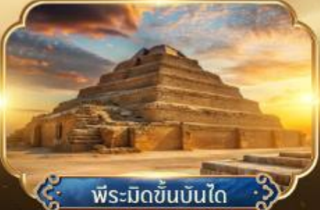
พีระมิดขั้นบันได