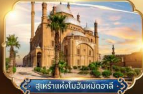
สุเหร่าแห่งโมฮัมหมัดอาลี