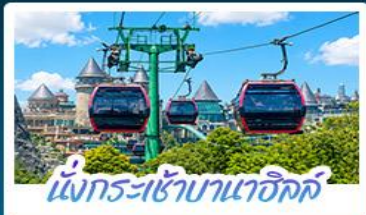
นั่งกระเช้าบานาฮิลล์