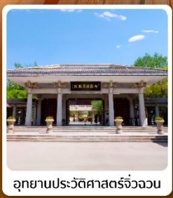
อุทยานประวัติศาสตร์จิวจวน

ไฮไลท์! เขตท่องเที่ยวเทียนจิงจางหม่า ชมทุ่งหญ้าและภูเขาสวยแห่งกานซู ภูเขาสายรุ้งจางเย่ต้นเสี่ย "มหัศจรรย์ภูเขาสายรุ้งหลากสี"