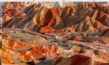
ภูเขาสายรุ้งจางเย่ต้นเสี่ย