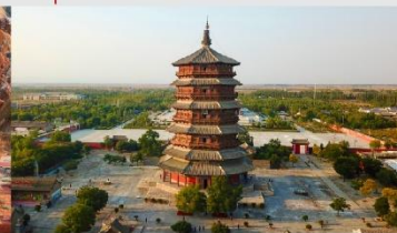
วัดเจดีย์ไม้ มู่ต้า

*ทางบริษัทฯ ขอสงวนสิทธิ์ในการสลับโปรแกรมทัวร์ตามความเหมาะสมขึ้นอยู่กับสถานการณ์หน้างาน โดยคำนึงถึงผลประโยชน์ของลูกค้าเป็นสำคัญ