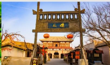
เมืองโบราณตุนหวง