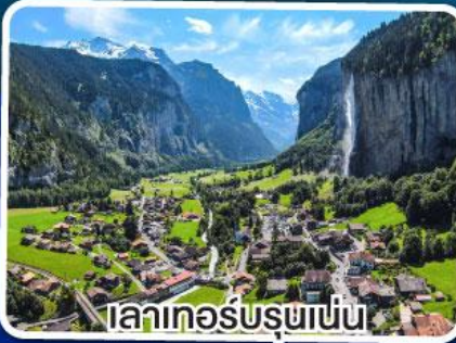
เลาเทอร์บูรนาเบิน