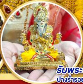
รับพระพิฆเนศวร ปางรำรอย ท่านละ 1 องค์