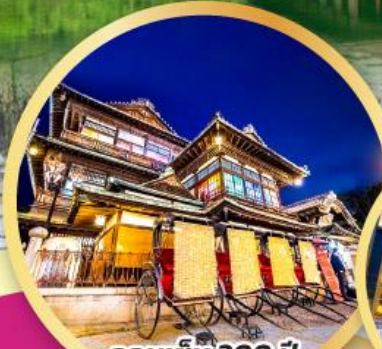
ออนเซ็น 300 ปี โตโจ-ออนเซ็น