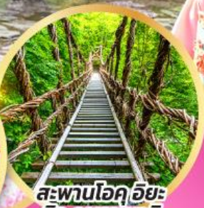
สะพานโอคุอียะ นิจู คาซุระบาชิ