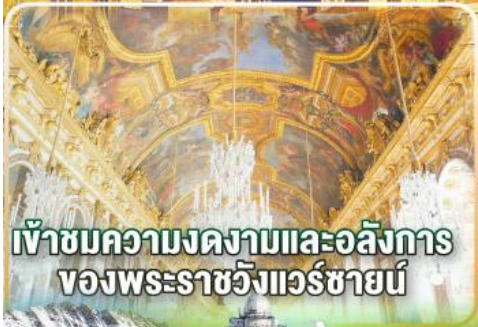
เข้าชมความงดงามและอลังการ ของพระราชวังแวร์ซายน์