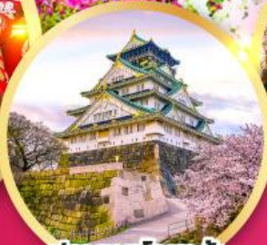
ปราสาทโซาก้า