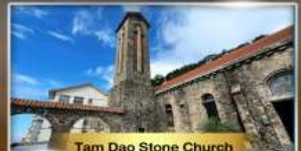
Tam Dao Stone Church