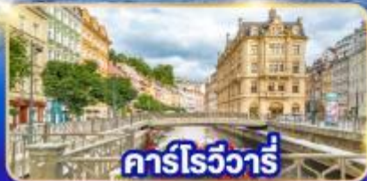
คาร์โรวัวร์