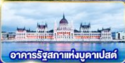
อาคารรัฐสภาแห่งบูดาเปสต์