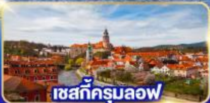
เชสกีครุมลอฟ