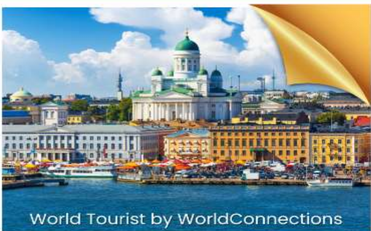
World Tourist by WorldConnections