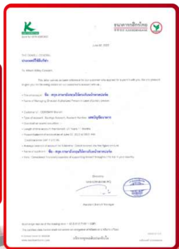
ตัวอย่าง Bank Guarantee ที่ผู้สมัครต้องยื่นกับธนาคาร