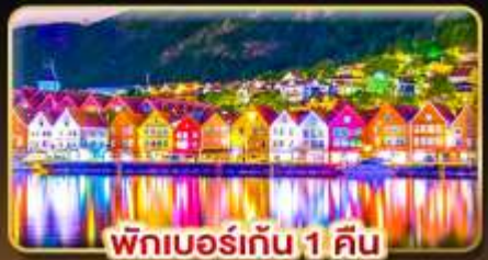
พักเบอร์เกน 1 คืน