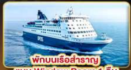
พักบนเรือสำราญ แบบ Window Room 1 คืน

สัมผัสความเป็นที่ที่สุดของ สแกนดิเนเวีย ให้ท่านได้พักผ่อนแบบ SLOW LIFE